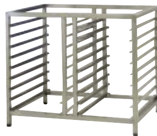
Supporto Stand Untergestell Pietement Soporte