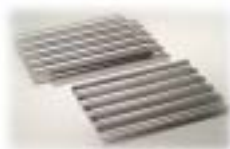
Teglie ondulate Corrugated trays · Gewellte Bleche Plaques ondulées · Bandejas onduladas