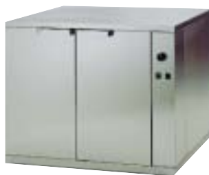
Lievitatore Leavening cabinet Gärkammer Chambre de levage Fermentadora