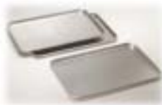
Teglie Trays · Bleche · Plateaux · Bandejas