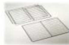
Griglie Grilles · Roste · Grilles · Rejillas

Le misure e i dati tecnici non sono impegnativi. La Ditta si riserva il diritto di apportare modifiche migliorative senza alcun preavviso. The sizes and specifications are approximate. The firm reserves the right to bring whatever modifications without any notice. Maße und technische Eigenschaften sind nicht bindend. Die Firma behält sich das Recht vor, ohne Vorankündigung verbessernde Änderungen vorzunehmen. Les dimensions et les données techniques ne sont pas contraignantes. La maison se réserve le droit de faire des modifications améliorantes sans aucun préavis. Las medidas y los datos técnicos no son definitivos. La Empresa se reserva el derecho de aportar mejoras sin preaviso.